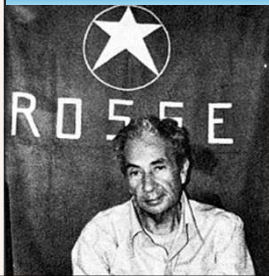
Aldo Moro, mag/78